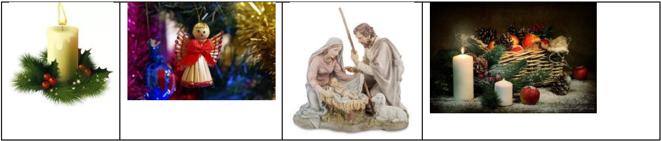
А) Новый год В) Благовещенье Б) Рождество Христово